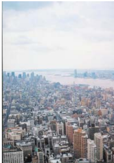
SÍMBOLO – Vista a partir do Empire State