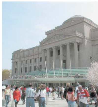
BOA SURPRESA – O Brooklyn Museum tem obras de Picasso e Degas

Sob o slogan 5 mil anos de arte, o Metropolitan, ou Met, para os íntimos, é imperdível. No mínimo, de dias inteiros. Não há de faltar o que ver. Na galeria dedicada aos pintores europeus, por exemplo, há nada menos que 37 Monets, 21 obras de Cézanne e 5 pinturas de Vermeer – o que faz