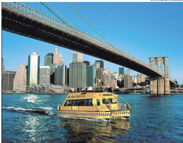
AMARELÃO – O Water Taxi segue até monumentos tradicionais, como a Ponte do Brooklyn

TARDE DEMAIS PARA ESQUECER Cinéfilos vão se lembrar do quase encontro entre Cary Grant e Deborah Kerr em Tarde Demais para Esquecer (1957) no Empire State Building (350, Quinta Avenida). Ou de King Kong escalan-