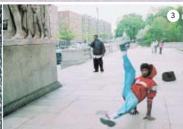
1. Hall da Fama do Grafite, no Harlem; 2. Uma escola do bairro; 3. Garoto ensaia passos de break na rua