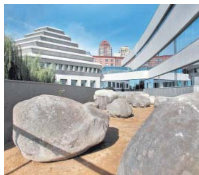
NA LISTA – Museu Judeu está entre os 15 sugeridos em circuito

De artefatos de bombeiros a peças de Wall Street, há de tudo em exposição