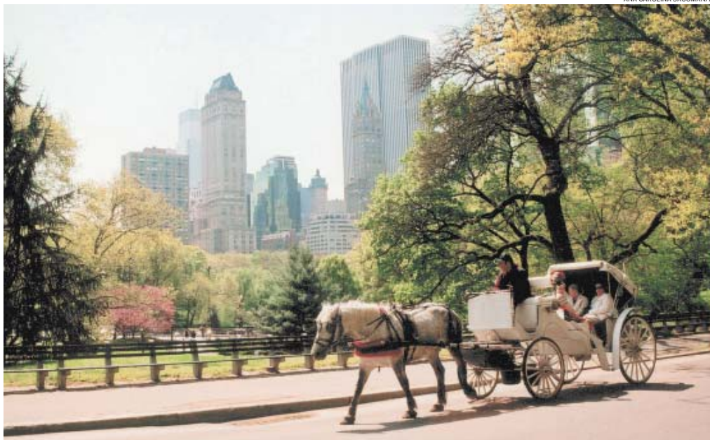
AO AR LIVRE – Passear no Central Park é um dos programas 'outdoor' preferidos por turistas e locais; neste mês tem teatro de graça lá

Aproveite o verão, época celebrada pelos nova-iorquinos,