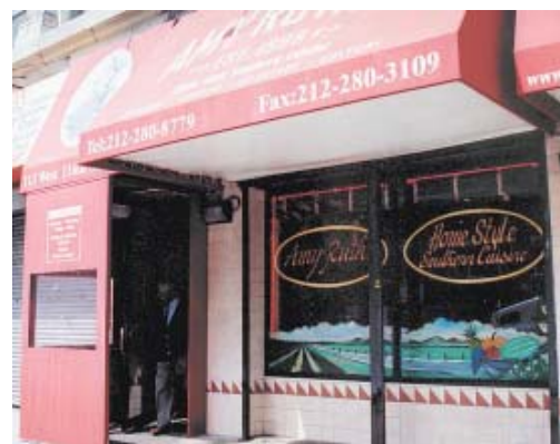
POINT – Até o presidente dos EUA, George W. Bush, passou por lá