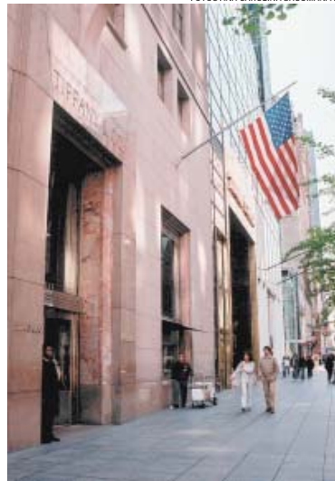
UM LUXO – Imite Audrey Hepburn na porta da Tiffany

do o prédio e apavorando Nova York (em todas as versões do filme). Já deu para perceber: o Empire State é um ícone que